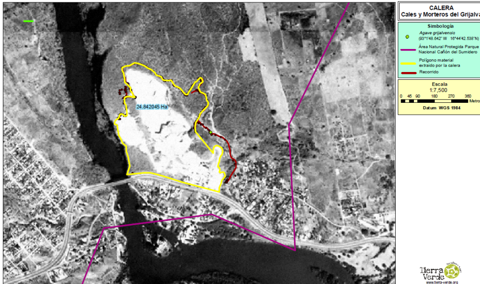
Fig. Ubicación de Calera Cales y Morteros del Grijalva S.A. de C.V. y delimita del ANP del Cañón Sumidero.

El establecimiento, regulación, administración y vigilancia de las ANPs son facultades de la federación con base el artículo 44 de la LGEEPA. La administración de esta ANP ha estado a cargo diferentes Secretarías, empezando con Secretaría de Asentamientos Humanos y obras públicas (SAHOP), y después la Secretaría de Medio Ambiente y Recursos Naturales y Pesca (SEMARNAP) y actualmente la Secretaría del Medio Ambiente y Recursos Naturales 2 , que “organiza y administra Áreas Naturales Protegidas, y supervisa las labores de conservación, protección y vigilancia de dichas áreas...” 3 por conducto de la Comisión de Áreas Naturales Protegidas (CONANP).