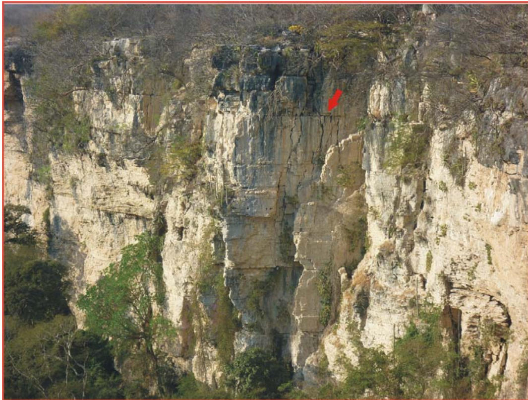
Figura 3: Fisuras en la pared del Cañón Sumidero a lado de la Empresa Cales y Morteros de Grijalva SA de CV.

La cara oriente de la pared del Parque Nacional Cañón del Sumidero el lugar donde se realiza esta actividad, está severamente dañada con cuarteaduras producto de esta actividad, sin olvidar que a escasos 20 metros se encuentra el Puente Internacional Belisario Domínguez, importante paso de comunicación entre el sur de nuestro país y Centroamérica.